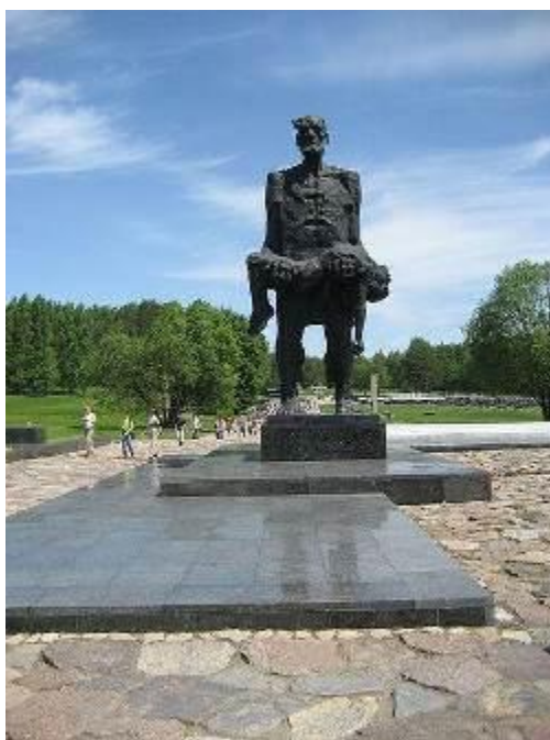
Хатынь, «Непокоренный человек»