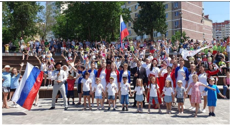
Концерт ко Дню России для жителей микрорайона Гидростроителей

Кроме того, родители принимают участие в управлении образовательной деятельности Центра. Все локальные акты Центра, касающиеся прав обучающихся и родителей, рассматриваются с учетом мнения Совета родителей, созданы родительские чаты для общения и обсуждения общих проблем, действуют и постоянно обновляются официальный сайт и социальные сети Центра, которые знакомят с новостями и достижениями педагогов и обучающихся.