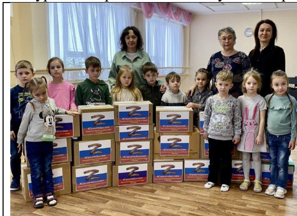
Посылки в зону СВО

Новогодние утренники, Выпускные концерты. Грандиозным праздником детского таланта становится ежегодный сводный отчетный концерт Центра по итогам обучения за год, с приглашением всех родителей и общественности города. Родители не остаются в стороне и при проведении патриотических и социальных акций. Каждая семья, каждый педагог неоднократно собирали и передавали посылки с гуманитарной помощью и детскими подарками участникам СВО, раненым в госпитали, детям Мариуполя и Луганска, принимали участие в концертах и флешмобах для ветеранов войны и труда г. Краснодара, участвовали в субботниках. Активная гражданская позиция и гуманитарная деятельность педагогов и родителей Центра отмечена Благодарственным письмом Администрации Карасунского внутригородского округа г. Краснодара, и дипломом Всероссийского конкурса «Патриотическое и духовно-нравственное воспитание».